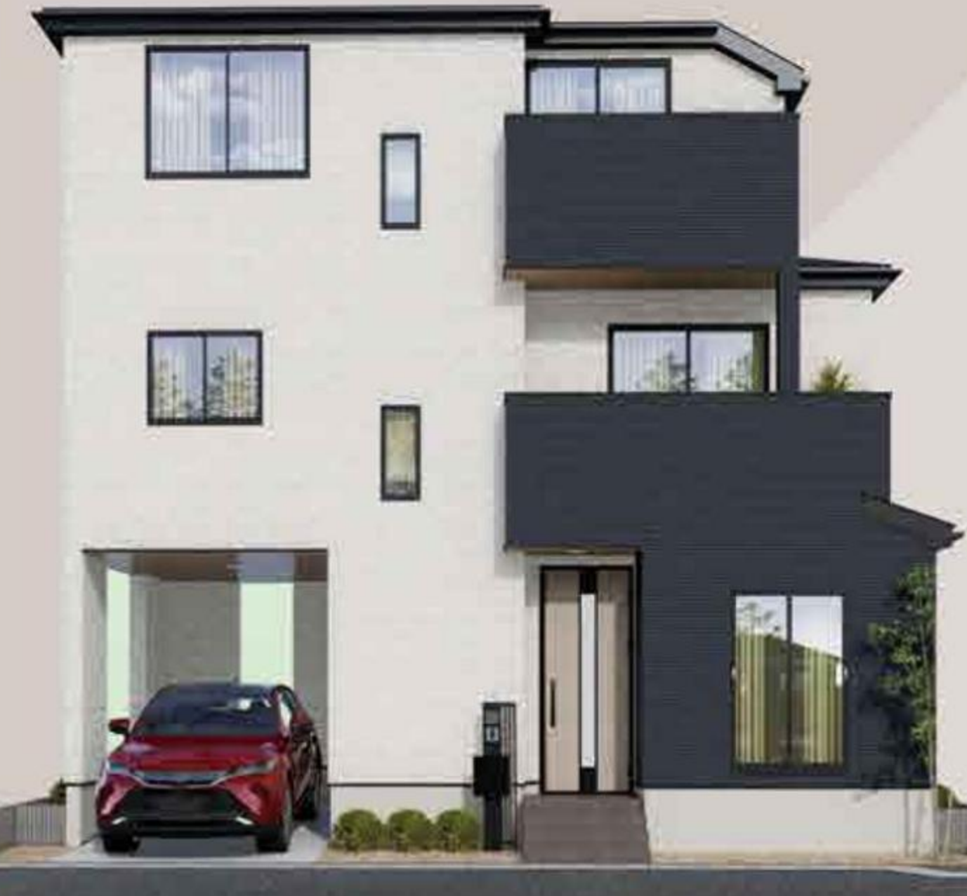
※イメージバースにつき実際とは多少異なる場合があります。